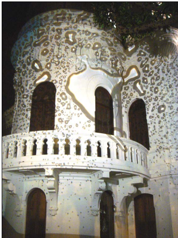
EXPOSIÇÃO E SEMINÁRIO H2O FUTURO DAS AGUAS

Realizado a partir de uma iniciativa do SESC RIO, o evento cultural concebido, produzido e coordenado pelo Instituto Contemporâneo de Projetos e Pesquisa – O Instituto - foi composto por uma exposição multimídia e um seminário que abordaram a importância da água para a vida no planeta, focando, especificamente, as questões ambientais e políticas que envolvem a questão no Brasil.